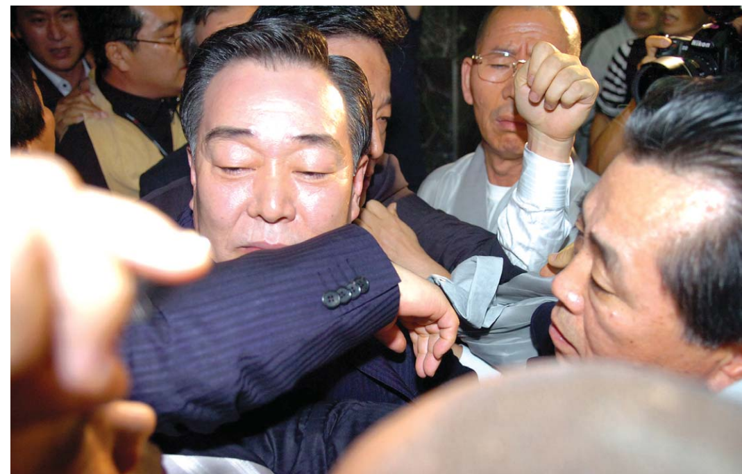
무례한 방문에 또 성난 불심 어청수 경찰청장이 9월 10일 오후 대구경북지역 불교대표자 간담회 가 열린 대구 동화사를 찾았다. 어 청장은 조계종 총무원장 지관 스님 등 종단 대표자들에게 사과의 뜻을 전하기 위해 공양 중인 ‘선열당’ 안으로 들어가려 했으나, 사부대중의 거센 항의로 인해 물싸움을 벌이다 결국 지관 스님을 만나지 못하고 돌아갔다. 박재원 기자

한편, 호소문에는 불교 52명, 카톨릭 51명, 개신교 115명, 원불교 51명 총 268명의 종교 지도자들이 서명으로 지지를 표했다. 노덕헌 기자