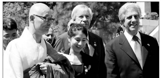
바스케스 우루과이 대통령(왼쪽) 3일 봉은사를 방문해 한국의 불교문화를 체험했다. 바스케스 대통령은 대웅전에서 참배하고 경배를 돌려본 후 대제전에서 주지명진 스님의 영접을 받고 차담을 나눴다.