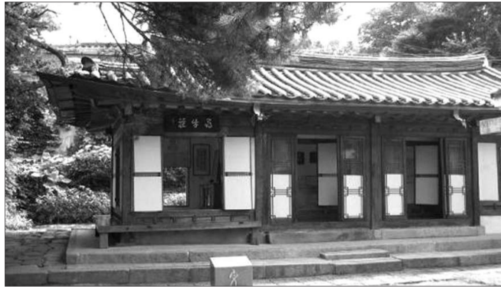
심우장(서울기념물 제7호) 모습. 동방대학원대 백원기 교수는 방치된 심우장을 성역화하자는 구체적 안을 최초로 제시했다.