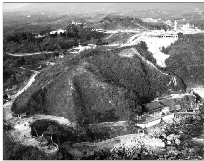
사적으로 지정된 양양 낙산사 전경.