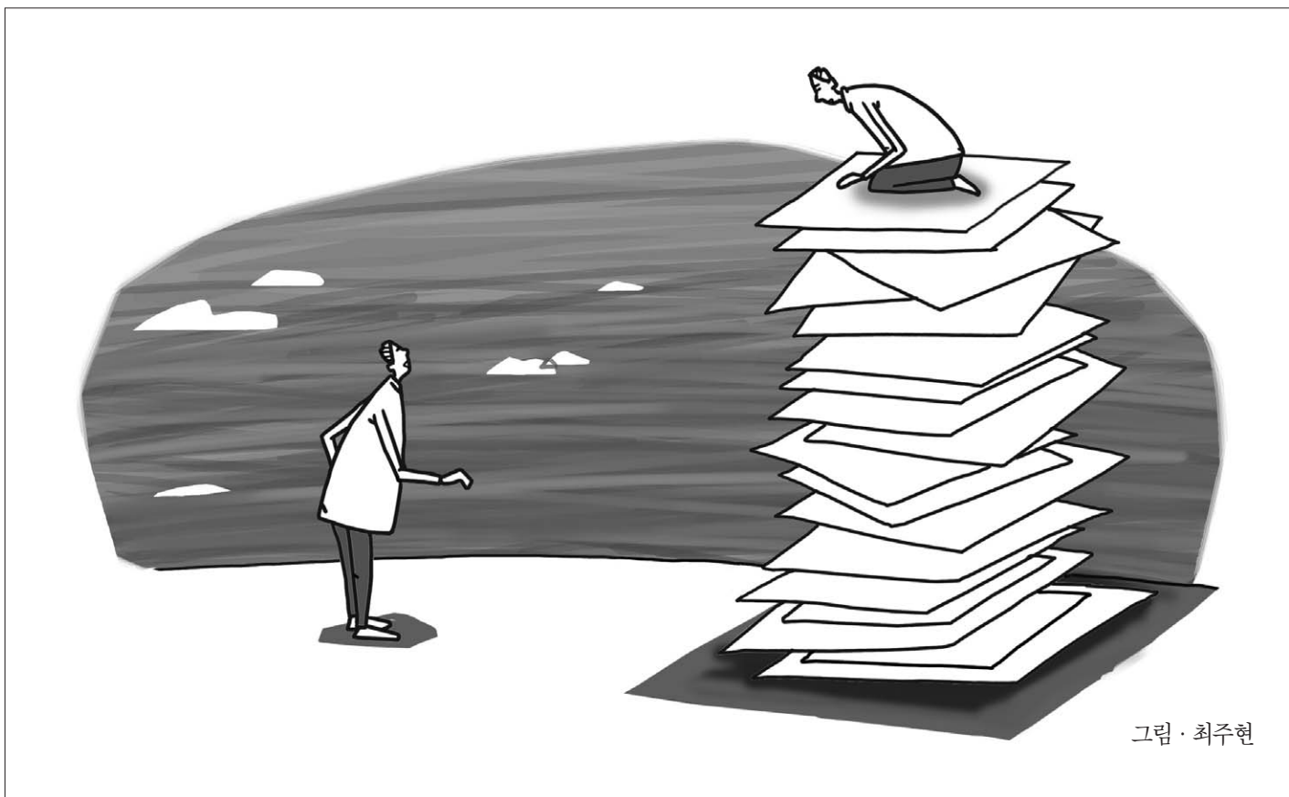
그림 · 최주현

▶ 전국 서점 또는 '온라인 여시아문' 에서 구입하실 수 있습니다. 온라인서점 여시아문 021737-0695