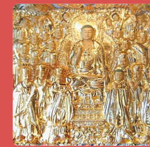
온양 수암사 지장 목탱화