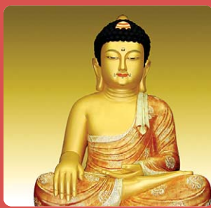
서울 송림원 석가모니부처님

저희 성불조각원은 불교 목공예를 전문으로하여 저희가 생산하는 모든 작품에는 작은 못하나 사용치 않고 짜맞춤 공법으로 제작하고 있습니다. 많은 시간과 수작업을 필요로 하지만 작은 경상 하나라도 대를 이어 물려줄 수 있는 그런 작품을 만들기 위해 최선을 다하고 있습니다. 앞으로도 이런 초심을 잃지 않도록 여러 대덕스님들의 조언과 질책을 부탁드립니다.