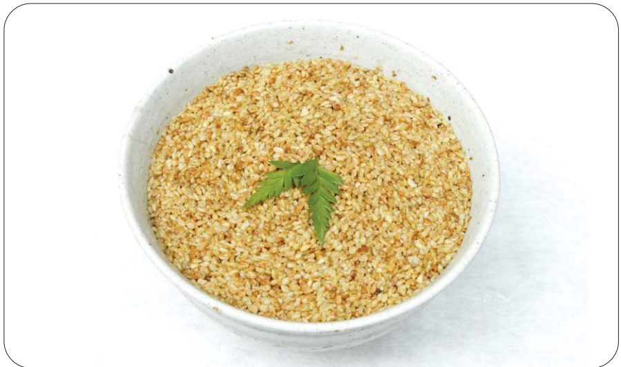
메밀차 재료: 메밀, 물, 죽염.