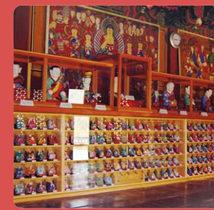
오대산 상원사 500나한