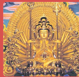
신흥사 천수천안 관세음보살