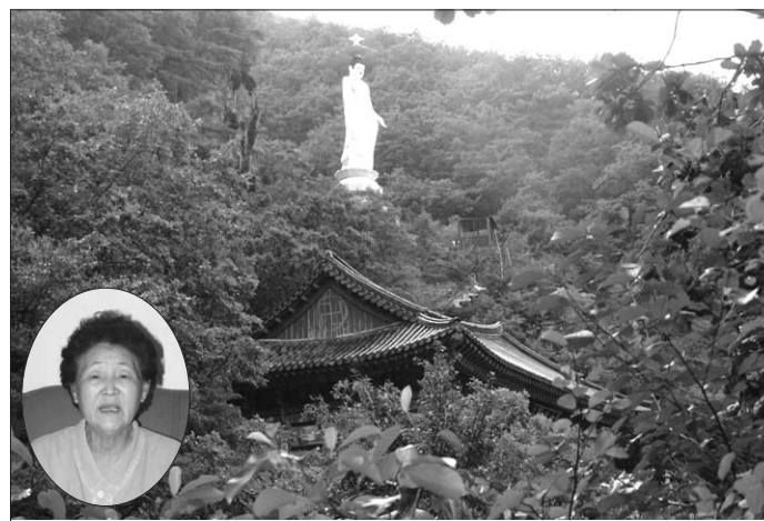
무심행 보살(원안)의 원력으로 지켜낸 포천 금룡사가 토지 매입금을 마련하지 못해 애매무매로 우고 있다.

무심행 보살은 1980년대, 사찰음식이 주목받지 못하던 때부터 제주 스님이던 어머니의 권유로 포천