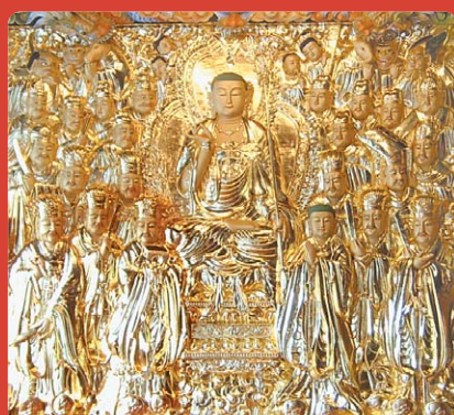
은양 수암사 지장 목탱화

귀의 삼보 하옵고 저희 성불조각원은 불교 목공예를 전문으로하여 저희가 생산하는 모든 작품에는 작은 못하나 사용하지 않고 짜맞춤 공법으로 제작하고 있습니다.