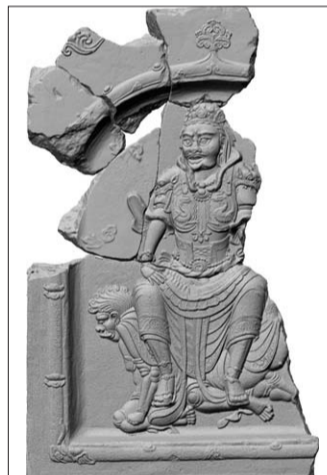
3D로 복원한 녹유전 A상.