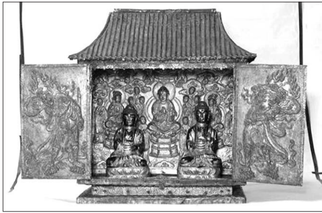
문화재청이 3월 11일 보물지정한 구례 천운사 금동불감(보물 제1546호).

가 감지은니법광명보살계묘보살계의(제268호) 등 4건, 성북구가 경국사팔상도(제262호) 등 5건, 강북구가 도선사출토동종및일괄유물(제259호) 등 7건, 서초구가 묘법연화경권2(제253호) 등 7건이다.