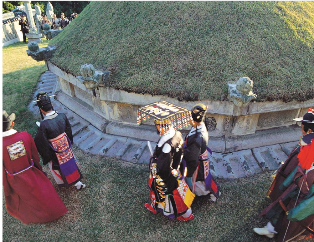
정조가 부친의 능을 참배하는 장면을 재현하고 있다(사진 왼쪽). 군복입은 정조.

그는 아버지 사도세자를 죽이고 세손까지 끌어내리려고 온갖 음모를 자행했던 무리들을 똑똑히 기억하고 있다. 흥인한 등과 결탁해 자신을 제거하려 했던 화완옹주(靖조의 고모)의 양아들 정후겸을 귀양보내고, 화완옹주는 서녀로 강등시켰다. 흥인한, 흥상간, 윤양로 등도 제거했다. 영조의 후궁 속의 문