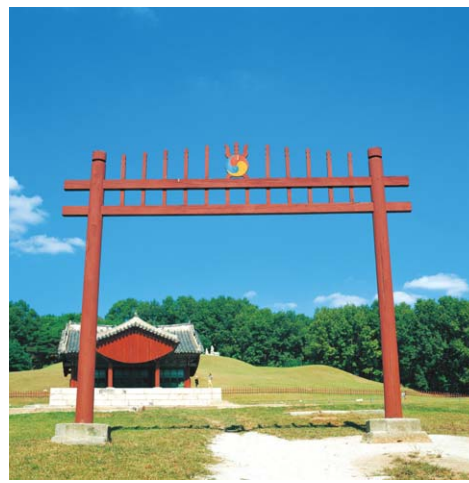
정조의 건릉 전경.

건릉은 조선 22대 정조와 그의 부인 효의왕후 김씨의 무덤이다. 경기 화성시 태인면 안령리 1-1에 있다. 용릉과 함께 사적 260호. 정조는 효성이 지극하였으며 많은 인재를 등용하고, 조선 후기의 황금문화를 이룩하였다. 건릉은 현릉원의 동쪽 언덕에 있었으나 효의왕후가 죽자 풍수지리상 좋지 않다는 이유로 서쪽으로 옮기기로 하고 효의왕후와 합장하였다. 무덤은 한 언덕에 2개의 방을 갖추었으며 난간만 두르고 있고, 그 외의 모든 것은 용릉의 예를 따랐다. 흠이 없는 자리인 혼유석이 하나만 있으며, 용릉과 같이 8각형과 4각형을 조화시켜 석등을 세웠다. 문무석은 사실적이며 안정감이 있는 빼어난 조각으로 19세기 무덤 석물제도의 새로운 표본을 제시하였다. 용건릉 - 면적 83만9669㎡ (25만4000평)