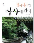
점심시간엔 산사에 간다 여태동 글 · 사진 크리에이트 펴냄 | 1만3500원

점심시간에 성형시술도 하는 세상이다. 하루의 유희를 찍는 점심시간동안 지하철 패스 하나로 서울 도심에 자리한 산사에서 마음을 달랠 수 있다면? <점심시간엔 산사에 간다>는 우이동 도선사에서 시작해 회계사·육천암에 이르는 도심 산사 20곳의 매력을 갈무리했다. 절로 향하는 교통편은 물론 간단한 가람 안내지도와 주석 중인 스님의 사회 활동 그리고 영험한 기도에도 얽힌 설화에 이르기까지 망라한 도심 사찰 기행의 마스터플랜이다.