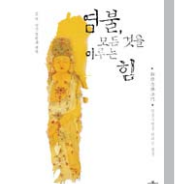
염불, 모든 것을 이루는 힘 원영 광오 지음 · 정영규 편역 불광출판사 펴냄 | 1만원