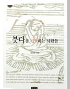
붓대를 기억하는 사람들 김광하 지음 운주사 펴냄 | 9800원