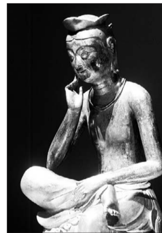
벨기에 브뤼셀에서 열리는 '한국 불교 미술특별전'에 열리는 국보 제78호 금동미륵보살반가상.

한편 금동미륵보살반가상의 해외 나들이는 1960년대부터 한국 문화의 해외홍보를 위해 이뤄졌으며, 이