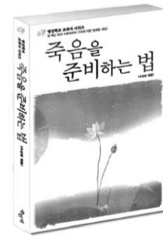
수신재 역음 · 문화영역 지 · 328쪽 · 값 12,000원