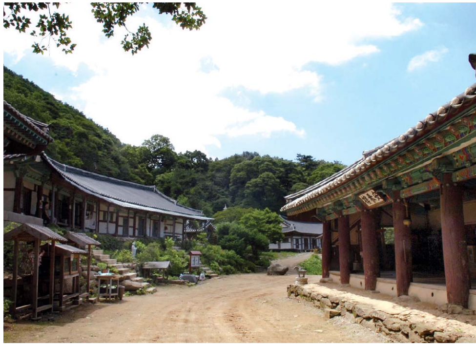
산사 분위가 물씬한 서산 부석사(사진 왼쪽)와 태안마애삼존불(오른쪽 위). 수덕사 전경(오른쪽 아래).

●은행나무 전설 품은 흥주사=흥주사는 고려 말엽 창건한 고찰이다. 만세루(충청남도 유형문화재 제133호)와 삼층석탑(충청남도 유형문화재 제28호) 등과 함께 삼목설화 담긴 1000년 된 은행나무가