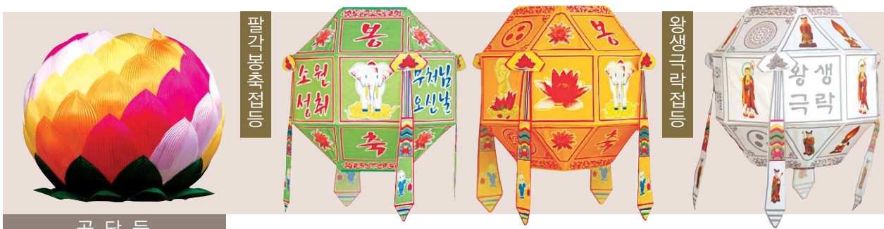
공 단 등

찬덕연등에서는 KS케이블을 사용하여 가장 안전하게 전문 기술인에 의해 직접 감독 시공합니다.