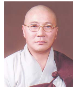
남해 미륵암 주지 청운

는 마음속에 명심하여 발원하는 마음을 일으켰는데 이것이 발원문이다. "저희들은 이 거룩한 인연으로 해서 앞으로 꼭 정각을 이루어나이다. 저희들이 거룩한 인연으로 해서 앞으로 보살의 도를 수행하고 깊은 법문을 체득하여 걸림이 없는 법을 보살과 같이 되게 하여 주소서" 그리하여 상제보살은 범용보살에게 앞에서 있었던 일을 상세하게 얘기하며 이렇게 범용보살의 지리에 참석하게 되어 너무 기쁘다고 했다. 그러자 범용보살의 설법이 시작되었다. "부처님의 몸은 어디부터 왔는가. 온 곳도 없고 가는 곳도 없다. 이것은 모든 법의 참다운 성품(眞性)이 부동하기 때문이다. 그 밖에도 진여(眞如), 비승(法身), 법성(法性), 불허망성(不虛妄性) 불변이상(不變異性), 평등성(平等性), 이성(離性), 정성(定性), 무성(不生), 계발의성(戒發의성), 허공계, 부사의계, 무성성, 무멸성, 여신성, 원시성, 적멸성, 주성, 공성... 이러한 것들이 모두다 오는 것도 없고가는 것도 없다." 범용보살은 이처럼 가르침을 자세하게 보