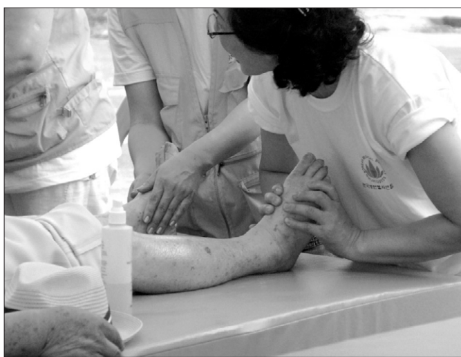
병불련 회원들이 7월 13일 덕주사에서 어르신들에게 발마사지를 해주고 있다.

이렇게 시작한 의료 봉사가 3회째에 이르자 더 많은 주민들이 의료 혜택을 받게 됐다. 65세 이상 어르신을 포함한 양파축제에 참가한 모든 지역주민들을 대상으로 확대된 것이 뜻에 동참하고자 병불련, ‘반갑다 연우야’, 덕주사신도회, 마하연 선원신도회, 고려아카데미, 동주병원 등도 후원을 아끼지 않았다.