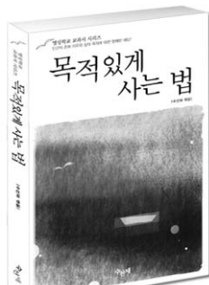
수선재 역음 · 356쪽 · 값 12,000원

【 그 외 명상학교 교과서 시리즈 】 건강하게 사는 법 · 사랑의 상처를 달래는 법 · 행복하게 일하는 법(근간)