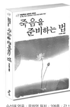
수선재 역음, 문화영 원저 · 328쪽 · 값 12,000원