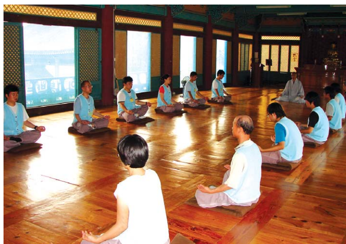
7월 18일 금산사 수련법회 참가자들이 참선을 통해 자신을 관하고 있다.

무더위가 기승 부리는 요즘 나태하기 쉬운 자신을 가다듬어 마음을 뒤고 영혼을 살피우는 수련법회가 7월 18-20일 김제 금산사에서 열렸다.