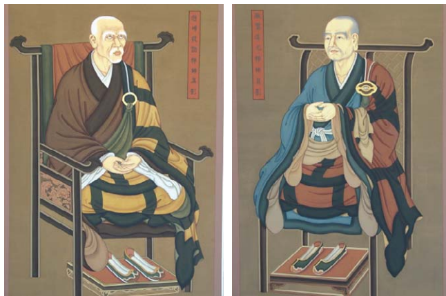
화순 쌍계사에 봉안된 조주 선사(좌)와 철감 선사 영정.

‘차 마시는 것과 선 수행이 한 맛(茶禪一味)’이라는 말은 선종 차문화를 단적으로 표현하는 예다. 중국 조주 스님이 ‘깍다거(喫茶去)’라 말해 선다(禪茶)의 효시라면, 한국에는 철감 선사가 있다. 조주 선사와 철감 선사는 스승 남전 선사 밑에서 11년간 법연을 맺은 사이기도 하다. 이런 가운데 7월 12일 화순 쌍봉사(주지 영재)에 선종 차문화의 주역 조주 선사와 철감 선사의 영정이 봉안돼 ‘깍다거’의 법연을 이었다.