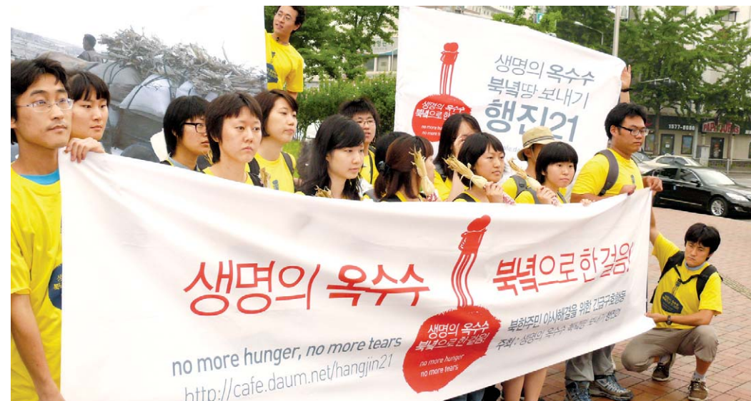
북한 기아돕기 캠페인을 위해 도보행진에 나선 ‘행진21’ 회원들.