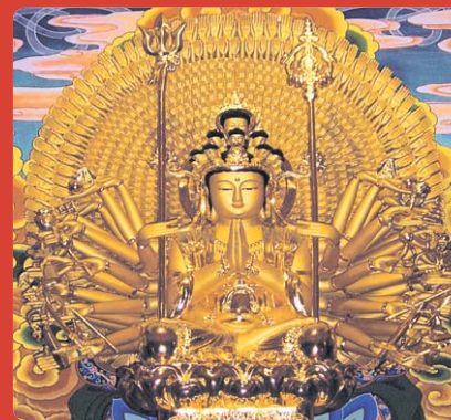
신흥사 천수천안 관세음보살