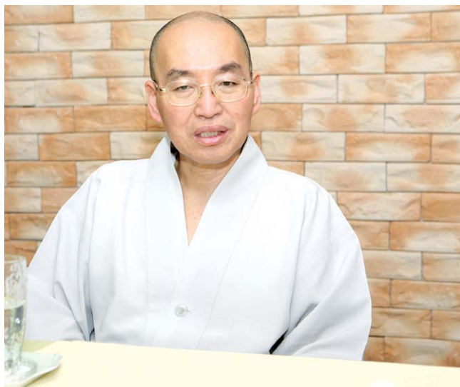
7월 4일 현재, 40일째 단식기도 중인 법륜 스님.

북한은 2년 연속 수해에 따른 흉년과 국제 농산물 가격 급등, 외부 지원 감소 등으로 10년 만에 대기근 위기에 처해 있다. 지금은 대량아사사태가 발생하려는 초기단계이며 이렇게 급박한 상황이기 때문에 법륜 스님은 이명박 대통령이 빨리 결단을 내려 북한에 식량 20만 톤을 지원해주기를 기다리고 있다. 지금 북한에 식량을 보내지 않으면 90년대에 발생한 대량 아사(餓死)사태보다도 더 심각한 사태가 일어날 수 있음을 경고했다. “아무리 굶어도 안 되니까 ‘나’라도 굶어서 아픔을 나눠야겠다”고 생각했습니다. 내 배가 고프면 동포들이 굶어죽는 것에 대한 한순간도 잊지 않을 것 아닙니까. 그리고 기도하는 사람이 먹을 것 다 먹고 잠잘 것 다 자고 기도한다