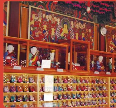
오대산 상원사 500나한