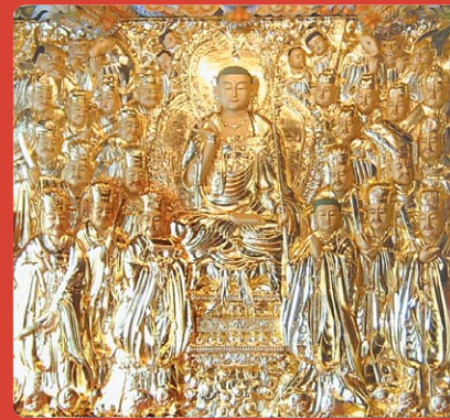
은양 수암사 지장 목탱화

귀의 삼보 하옵고 저희 성불조각원은 불교 목공예를 전문으로하여 저희가 생산하는 모든 작품에는 작은 못하나 사용하지 않고 짜맞춤 공법으로 제작하고 있습니다. 많은 시간과 수작업을 필요로 하지만 작은 경상 하 나라도 대를 이어 물려줄 수 있는 그런 작품을 만들기 위해 최선을 다하고 있습니다. 앞으로도 이런 초심을 잃지 않도록 여러 대덕스님들의 조언과 질책을 부탁드립니다.