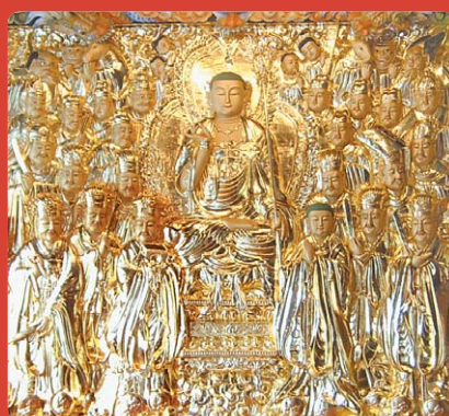
은양 수암사 지장 목탱화

귀의 삼보 하옵고 저희 성불조각원은 불교 목공예를 전문으로하여 저희가 생산하는 모든 작품에는 작은 못하나 사용 치 않고 짜맞춤 공법으로 제작하고 있습니다.