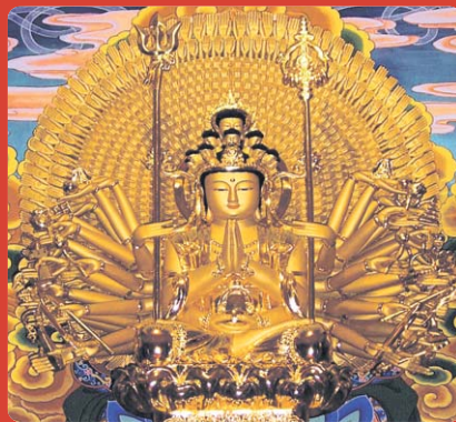
신흥사 천수천안 관세음보살