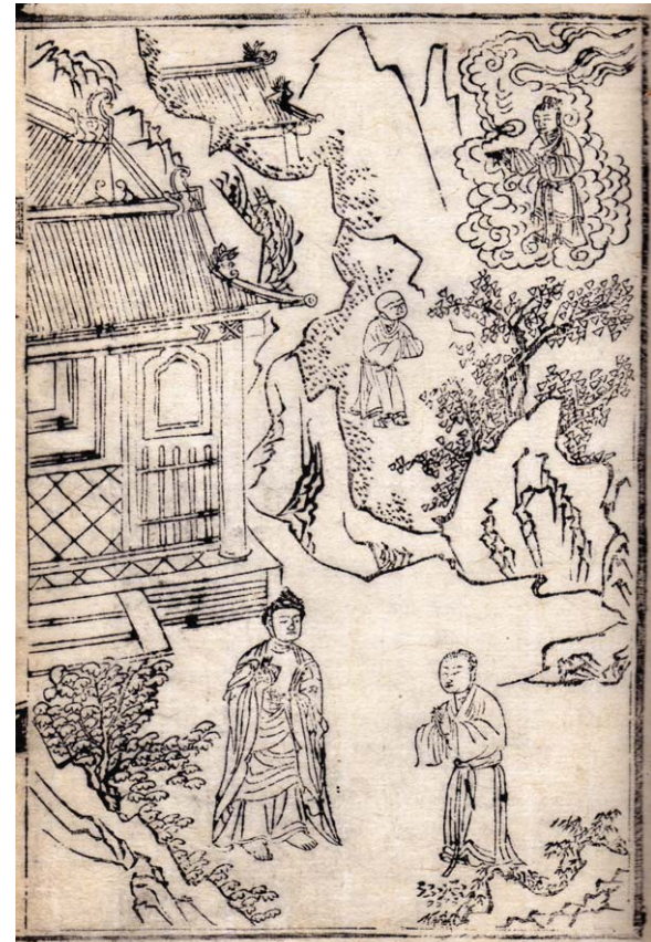
석씨원류(石氏源流) 중 죽원정사(竹園精舍) 불암사판(佛岩寺版) 1673년(牛脚) 27.2 x 18.0cm