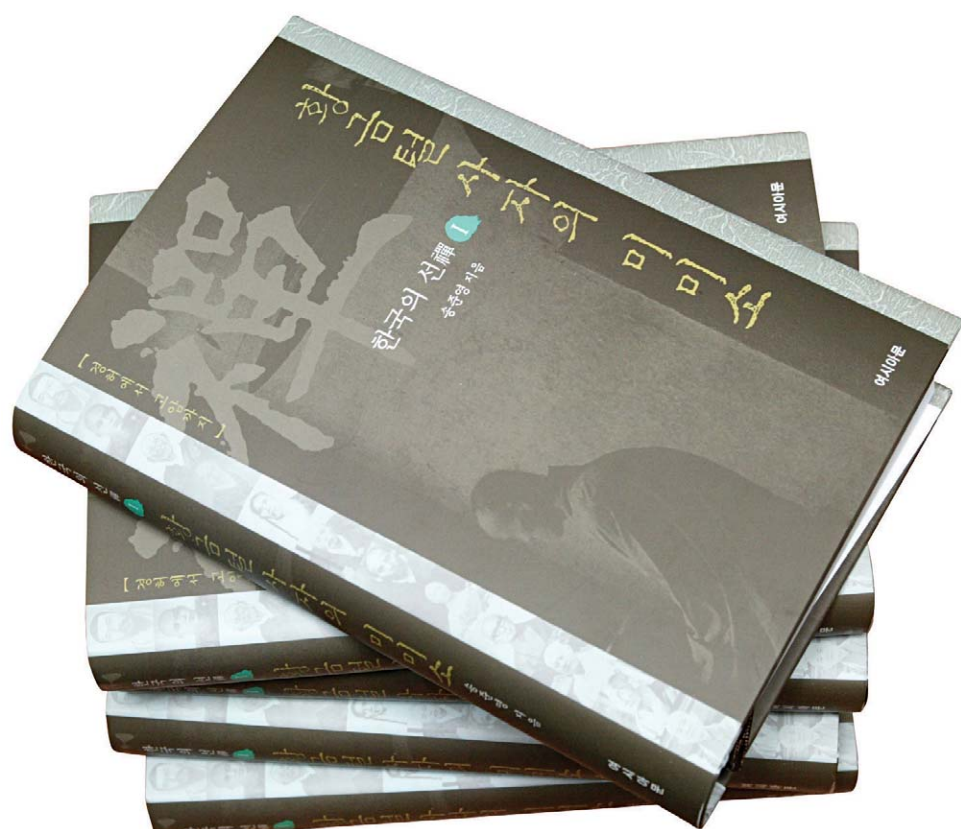
[송준영 지음 / 여시아문 펴냄 / 575쪽 / 25,000원]

- 이번 책은 '한국의 선시'이라는 부제를 달고 있고, 경허 스님에서 정강 스님까지 다루고 있습니다. 계속 시리즈가 이어질 것으로 보이는데 어떤 계획을 갖고 계신지요? 지금 2권의 자료가 거의 준비되고 있습니다. 고암, 금오, 청담, 탄허, 성철, 서운 등등의 제 선사들의 선시와 선, 2권 역시 12명의 선시를 기록할까 합니다. 특히 1권에서 자료부족으로 실지 못했던 해월 선시에 대해 기록할까 합니다. 후 귀중한 자료를 가지고 계시는 분이 계시면 수월 선사와 해월 선사의 자료를 보내 주시면 도움이 되겠습니다. 올 겨울이면 제2권이 진행될 것입니다.