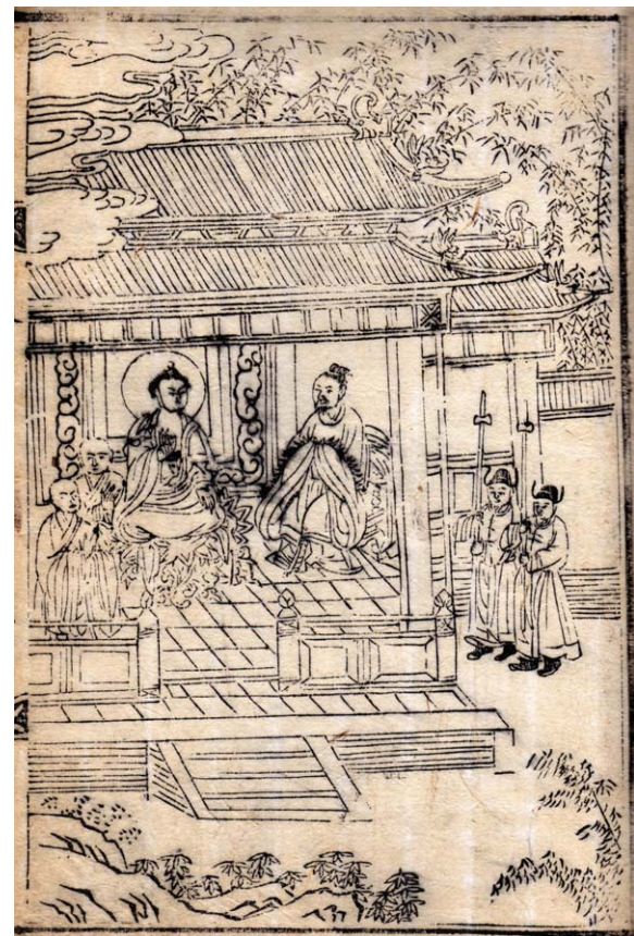
석씨원류(薛氏源流) 죽원정사(竹園精舍) 불암사판 1673년간행, 반각(半角) 27.2 × 18.0cm