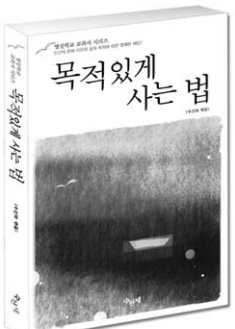
수신재 역음 · 366쪽 · 값 12,000원

그 해답은 명상 수행에서 찾을 수 있다. 명상 수행을 통해 ‘진리를 보는 눈’이 열려 참된 본성과 하나가 되면, 누구나 직관적으로 인생의 목적을 깨달을 수 있다.