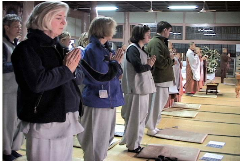
미국인들은 실용주의적 관점에서 불교를 받아들여 현실에 적용하고자 노력한다.

미국 중남부지역을 중심으로 태동한 실용불교는 서구사회에 접목하는 새로운 불교운동의 한 단면이다. 이는 자치 참여 불교와 혼용될 수 있으나 기본취지와 적용범주 등 여러 측면에서 구분된다. 실용불교는 역사적 실존인물인 시타르타의 선구적인 계몽사상을 현대 서구인의 생활과 사고에 적절히 원용, 응용하려는 시도다. 이 흐름을 알자면 먼저 실용주의에 대한 사전적 의미부터 잠시 살펴보는 것이 바른 순서다. 이하 간추린 내용이다. 실용주의(pragmatism)는 20세기 미국문화의 대표적 특성 중 하나며 간혹 실용주의(practicalism)나 기능주의(functionalism)