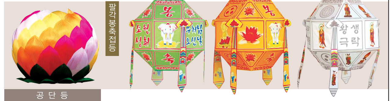
공 단 등

찬덕연등에서는 KS케이블 을 사용하여 가장 안전하게 전문 기술인에 의해 직접 감독 시공합니다.