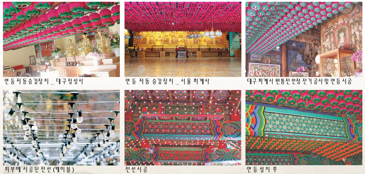
연등저등승강장치 _ 대구장성사