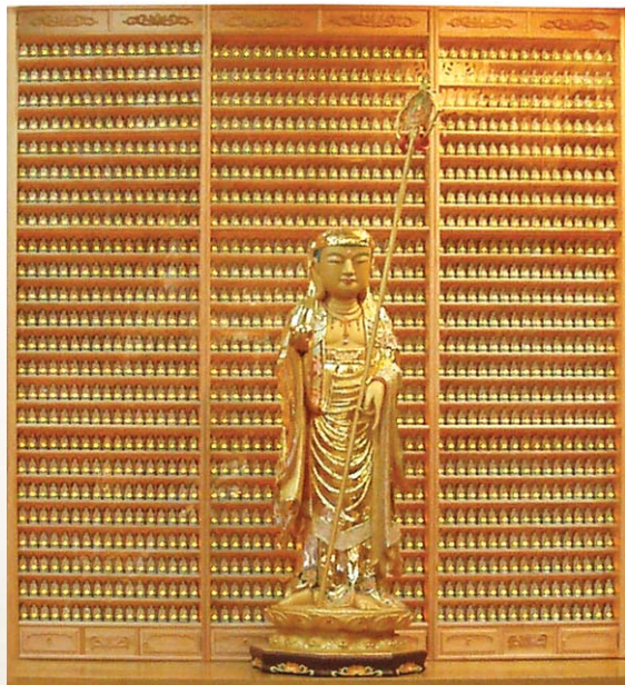
마산 금강정 투사 LED 인등