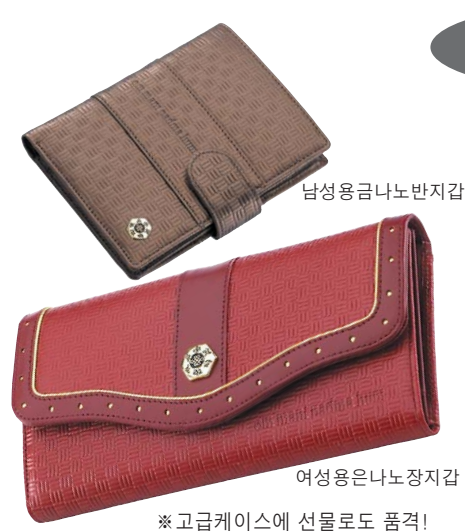
※ 고급케이스에 선물로도 품격!

라니복지갑은 동서사방에서 돈이 들어오게 하는 비방의 법구와 막혔던 모든 문제를 해결되게 하는 영험의 법구가 들어 있으며 음양의 조화로 원하는 소원이 성취되게 왕진언이 지갑 앞면에 들어있다. 고급소가죽에 금니노, 은나노 처리 까지한 일반 지갑과는 비교될 수 없게 내부도 잘 꾸며져 있고 불광사에서 지갑 사용하실 분의 물질의 소원과 원대한 계획이 성공되게 생년월일을 알려주면 100일 축원불공을 해드립니다. 남성용 금나노 반지갑 65,000원 여성용은나노장지갑 95,000원 전화로 신청하시면 택배로 보내 드립니다. (신용카드 분할가) 문의: (02) 741-4488 농협 032-12-193445 이상하