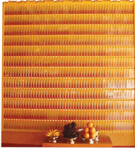
양주 석본사 영구위패

찬덕연등에서는 KS케이블 을 사용하여 가장 안전하게 전문 기술인에 의해 직접 감독 시공합니다.