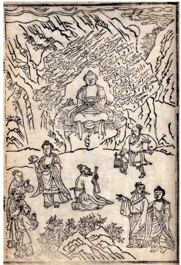
석씨원류(釋氏源流) 중 항복화룡(降伏火龍) 불암사편 1673년(간행: 반곡(半郭) 27.2 x 18.0cm)

불암사편 석씨원류에 등장하는 삼화 중 한 장면으로 마가다국의 유명한 수행자 집단인 가섭 삼형제를 교화하기 위해 독룡을 항복시키는 이야기가 담겨있다. 가섭을 만나 독룡의 방에 들기를 청하고, 독룡의 방에서 독룡을 항복시켜 독룡을 작게 만들었다. 발우에 독룡을 담아 가섭에게 보여주는 장면이 왼쪽에서 오른쪽으로 순서대로 묘사됐다. 이 사건을 계기로 가섭 삼형제와 1000명의 제자들은 불법에 귀의했고, 불교는 거대한 교단을 형성해 본격적인 교화활동의 교두보를 확보했다. 석씨원류에 부처님은 배화교도였던 가섭형제와 1000명의 제자들을 위해 마가국 수도였던 왕사성으로 향하다 가야산에 이르러 '타오르는 불의 법문'을 설했다. "비구들이여, 모든 것이 불타고 있다. 눈이 불타고 있다. 눈에 비치는 형상이 불타고 있다. 형상을 받아들이는 마음도 불타고 있다. 어떤 불에 의해 타고 있는가? 탐욕·분노·어리석음의 불에 의해 타고 있다. 비구들이여, 이와 같은 불길들은 왜 일어나는가? '나' 스스로가 일으킨 망상이 부식들이 되고 불씨가 돼 어리석음의 검은 연기를 피워 올리고 탐욕과 분노의 불길을 일으키기 때문이다. 중생들은 모두 탐욕과 분노와 어리석음이라는 세가지 독의 거센 불길로 인해 나고 늙고 병들어 죽는 세계를 윤회하고, 근심과 슬픔과 고통과 번민 속에서 헤어지지 못하게 되느니라. 비구들이여, 탐욕과 분노와 어리석음의 세가지 불길이 거세게 타오르는 것은 오직 '나'에 대한 애착 때문이니, 세가지 불을 멸하려면 먼저 '나'에 대한 애착을 끊어 버려야 한다. '나'에 대한 애착을 끊을 수 있게 되면 세가지 불길은 스스로 꺼지고 윤회의 수레바퀴는 저절로 멈추며, 모든 괴로움은 자취 없이 사라지게 되느니라." 부처님의 불의 법문에서 우리는 마음속에 활활 타오르는 탐욕과 분노와 어리석음의 불을 끄고 열반의 세계로 나아가기 위해 끊임없이 정진해야겠다.