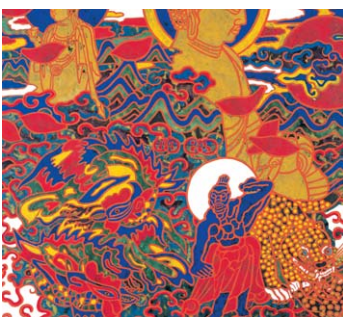
박생광작 <토함산의 해돋이>.

특히 고구려 벽화를 비롯해 불화·단청·민화·무속화로 우리 민족의 혼을 화려한 오방색으로 재현해온 박생광(1904~1985) 화가의 작품과 만나는 뜻 깊은 기회다. 더불어 전혁림, 이경성, 정상화 등의 대표작을 통해 한국 전통의 아름다움을 현대미술을 통해 새롭게 발견한다. 한용진 등 지역 미술인들의 조형물 설치물 통해 자연 친화적인 예술상도 소개한다.