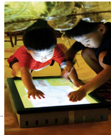
▶마음대로 놀이터에서 예술체험을 하는 어린이들의 모습.