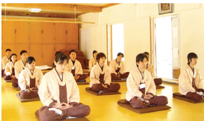
금산사 템플스테이에서 참가자들이 참선을 하고 있다.