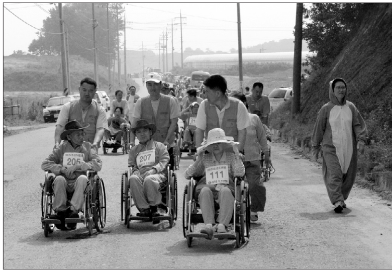
“출발!” 효사랑 마라톤 대회에 참여한 사람들이 안성 죽산면 길을 달리고 있다(왼쪽 사진). 어르신들도 이날 바깥 나들이에 나섰다. 모두들 마라톤대회로 인해 마음이 따뜻해졌다.