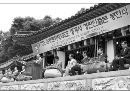
경기도 의왕 청계사주지 성행는 5월 22일 ‘경판 인출본 봉헌의례’를 봉행 했다. 의례에는 청계사 회주 종상 스님과 불국사 승가대학장 덕민 스님을 비롯한 스님들과 김문수 경기도지사 이형구 의왕시장 박석근 의왕시의회의장 등 지역 인사 등 1천여명의 사부대중이 참가했다. 이날 의례에서는 지난해 12월 20일부터 올 3월 26일까지 전통방식으로 세척하고 먹칠, 인출, 제본 등의 과정을 거친 466판에 새겨진 내용들을 인출한 책이 선보였다. 인출본은 <묘법연화경>과 불교강원교과목 및 의식문헌 등이다. 임연태기자