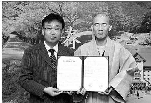
무주 한국사(주지 도안)와 무주군은 5월 14일 관광자원의 효율적 상호화와 문화체험을 겸한 템플스테이 관련 업무협약을 체결했다. 한국사가 운영하는 ‘산사로의 초대’ 프로그램은 1회 80명이 동참해 1박 2일과 2박 3일 일정의 예불과 108배, 참선, 발우공양 등 산사체험과 태권도 등을 배워볼 수 있는 문화체험 프로그램으로 진행될 예정이다. 이날 협약식에서는 한국사와 무주군이 템플스테이를 지속적인 무주투어 상품으로 운영해 나가기 위한 세부사항 등을 구체적으로 협의한 것으로 전해졌다. 조동제 전북지사장