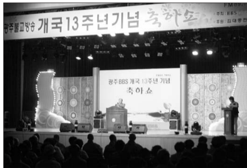
광주불교방송 개국 13주년 기념 축하공연이 5월 22일 광주컨벤션센터에서 열렸다. 광주불교방송 이상진 사장, 본부장 김강스님, 무등 스님 등 사부대중 100여명이 참석한 행사에는 가수 배일호, 소영, 강진씨 등 유명 연예인들이 참석하기도 했다. 이상진 사장은 “후남지역 포교를 위해 1995년 출범한 광주불교방송이 앞으로 바른 방송, 편안한 방송, 지우침없는 방송이 되도록 더욱 노력하겠다”고 말했다. 양형선 전남지사장