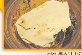
성철 큰스님 사리