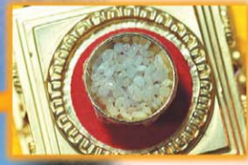
초대 까르마빠 사리