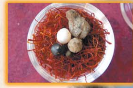
계세 라마 큰족 사리