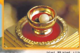
라마 풍카빠 사리