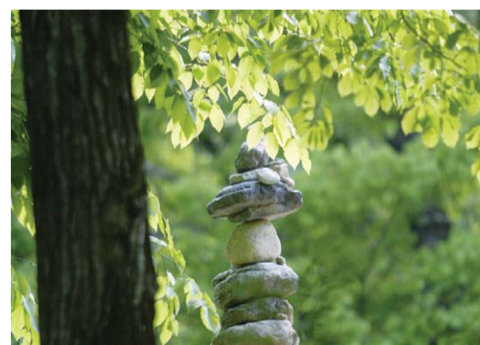
녹음이 짙어가는 5월의 해인사, 작은 소망을 쌓은 적석탑이 산사의 운치를 더하고 도량엔 수학여행 온 아이들로 아담법석이다.