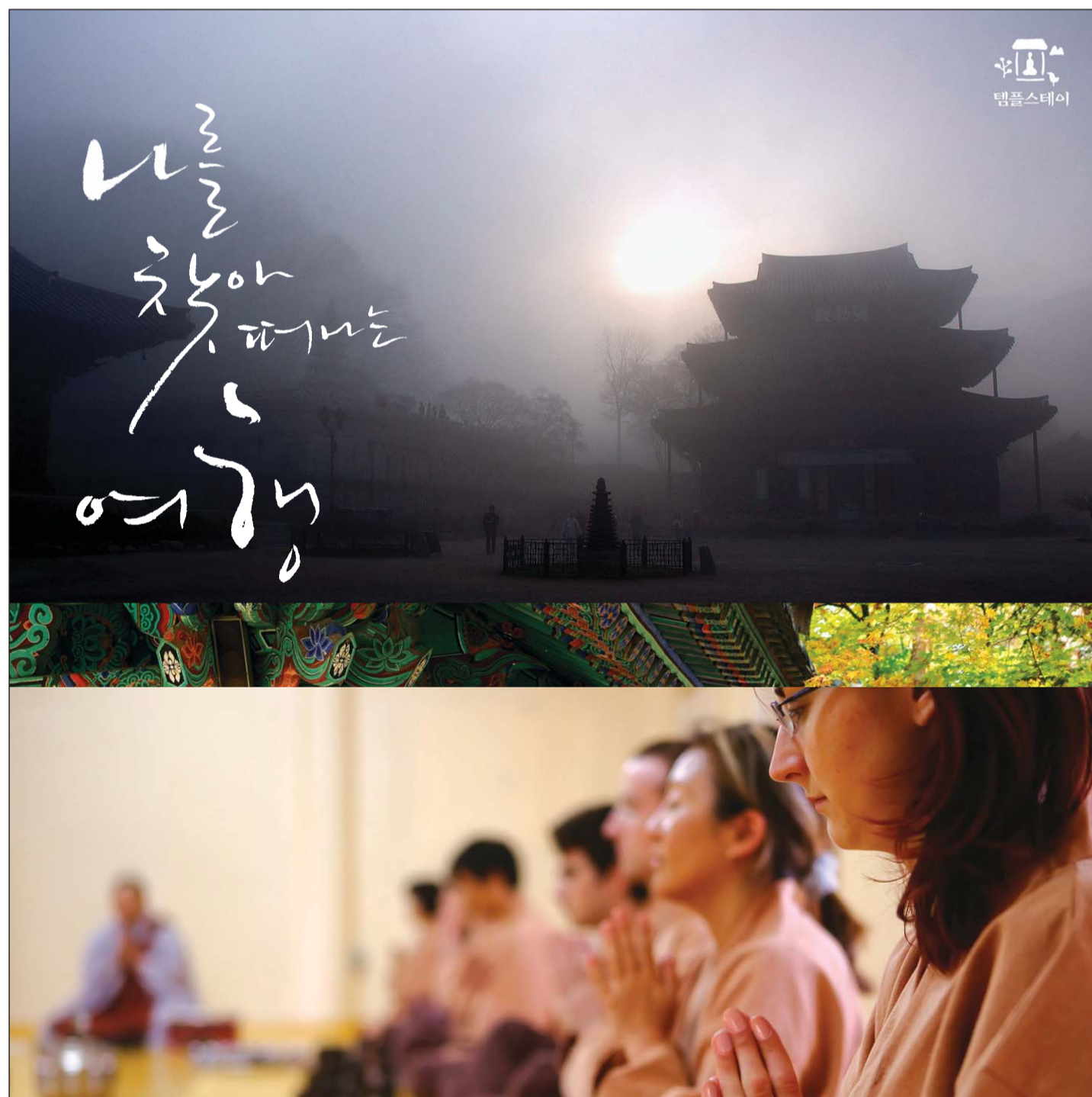
고즈넉한 산사를 채우는 풍경소리와 함께 자유로워지는 '참나를 찾아 떠나는 여행'

금주 캠페인입니다. ‘내인생의 불서 한권’은 불서를 통해 삶의 지혜를 얻거나 행복을 새롭게 발견한 체험담을 쓰는 코너입니다. 독자 여러분의 생생한 체험담을 기다립니다. 담당자: 김강진 기자 kangkang@buddhapia.com