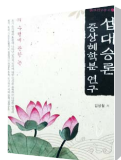
섭대승론 증상해학본 연구

현대 불교 문헌학 연구의 전형적인 틀을 갖추고 동시에 문헌학적 방법론의 성격과 한계에 도전하는 책은 김