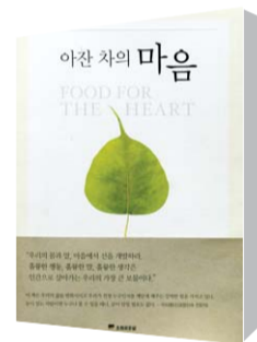
아잔 차의 마음

아잔 차 스님은 생전에 ‘세상에서 가장 행복한 사람’이라고 불렸다. 그러나 그가 가진 것은 입고 있던 옷 한