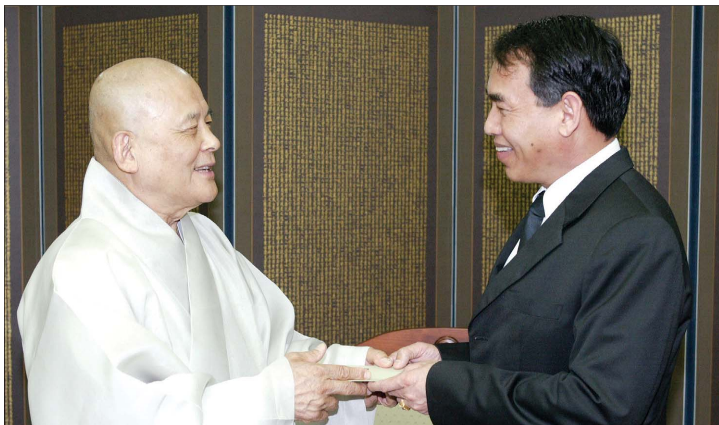
5월 7일 조계종 총무원에서 알 요르윈 주한미얀마 대사에게 성금을 전달하는 지관 스님.