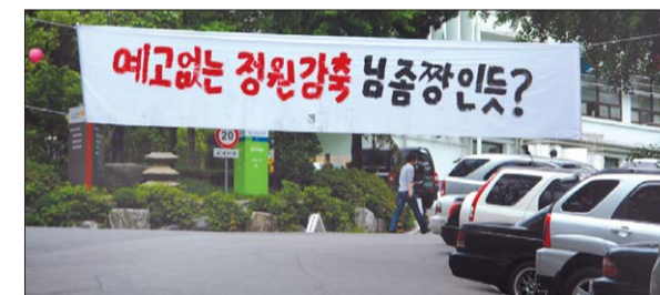
동국대 교정에 걸린 ‘상시입학정원관리시스템’ 비판 현수막.

학률·취업률 등을 기준으로 5년간 교내 평가 점수가 하위 1~8위 이내거나 하향조정지수가 일정 점수 이상 누적된 학과를 통폐합 대상으로 규정하고 있다. 교계 한 연구자는 “종합대학은 종합병원과 같다. 내원 환자가 적다고 특정 진료과를 없애기 시작하면 종합병원이라 할 수 있겠나?”고 반문했다. 한 원로학자는 2007년 200억 규모로 시작된 정부의 인문학 프로젝트(HK사업)를 예로 들며 “지금은 인문학 특성화가 필요한 때”라며 안타까워했다.