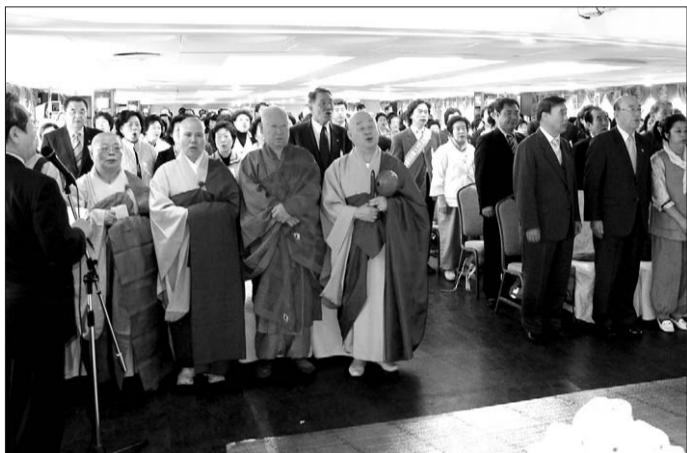
4월 26일 한강에서 열린 ‘나라와 중생을 위한 용왕대제’.

대한민국지키기불교도총연합회(공동회장 대표 박희도)와 대한불교조계종방생법회(회장 이근희)가 4월 26일 한강수상법당에서 ‘나라와 중생을 위한 용왕대제’를 봉행했다.