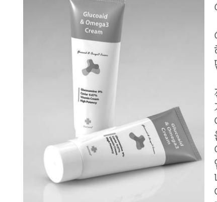
세상에 이럴 수가 통증이 싹

신기술 신물질로 만든 글로코에이 크림이 항상 통증으로 고통 받고 있는 사람들에게 새 희망이 되고 있다. 금강닥터사에서 시판되고 있는 글로코에이 크림은 팔꿈치 통증, 무릎 관절통증, 허리통증, 어깨와 목의 통증 등에 바르기만 하면 통증이 사라진다. 강원도 정선에 계시는 토굴 스님은 5년 전부터 무릎 관절통증으로 걷기도 힘든 가운데 팔은 관절이 손으로 하는 일을 많이 해 팔꿈치 L보까지 통증이 와서 물건을 들 수 없을 정도로 고통스러웠다. 병원에서 약도 먹고 파스도 부치고 바르는 소염 크림도 발라보고 몇 년간을 노력했으나 새벽만 되면 극심한 통증은 더욱 심해 이것이 나의 고행이라 생각하고 있던 중 50대 후반정도 되는 등산객이 비상용으로 항상 가지고 다닌다는 글로코에이 크림을