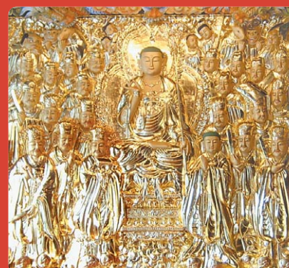
온양 수암사 지장 목탱화

귀의 삼보 하옵고 저희 성불조각원은 불교 목공예를 전문으로하여 저희가 생산하는 모든 작품에는 작은 못하나 사용하지 않고 짜맞춤 공법으로 제작하고 있습니다.