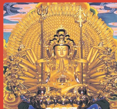
신홍사 천수천안 관세음보살