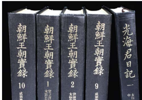
서울대 규장각 소장 조선왕조실록 영인본 일부.