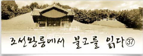
조선왕릉에서 불교를 읽다 ⑦

18대 현종과 원비 명성왕후 - 승릉 현종 1641~1674(34세) 재위 1659.5(19세)~1674.8(34세)