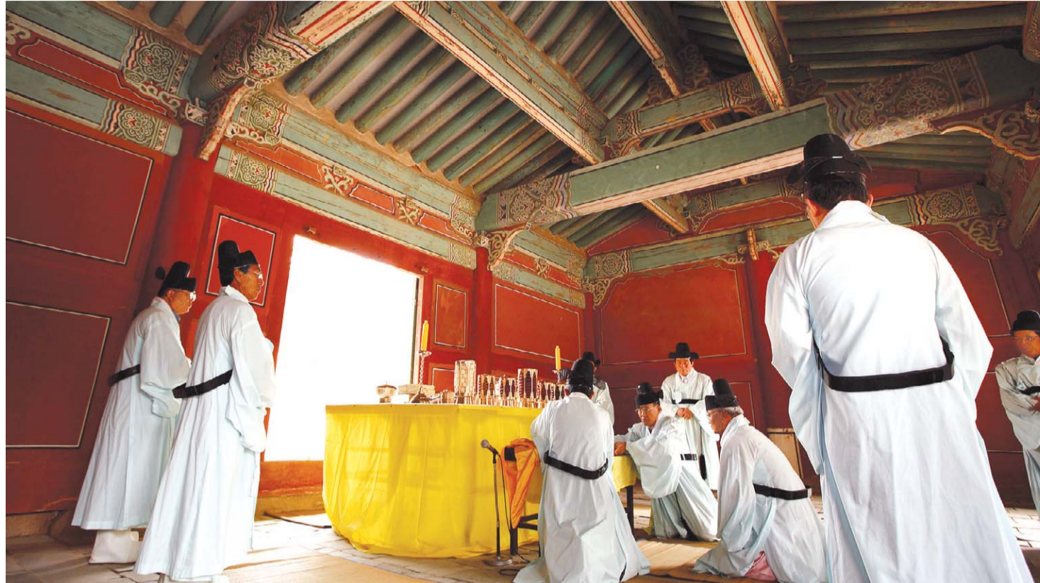
국사청 복장문제는 효종 때부터 현종 때까지 서인·남인의 주도권 싸움으로 부각됐다. 사진은 희령의 제향 모습.

사람은 태어날 때에/ 입안에 도끼를 가지고 나온 다/ 어리석은 자는 말을 함부로 함으로써/ 그 도끼로 자신을 찍고 만다. <숫나리과파, 657>