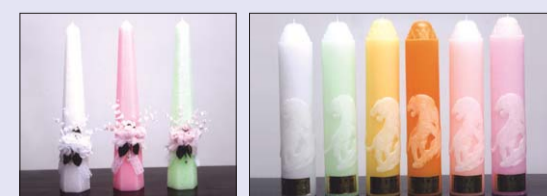
■ 육각초 45cm ■ 야광 호랑이(산신) 70φ X 35cm