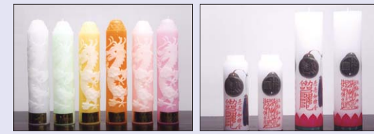
■ 야광 용초 70φ X 35cm ■ 원기둥 마패 7.4φ X 30cm 등신불 마패 4.7φ X 19.5cm