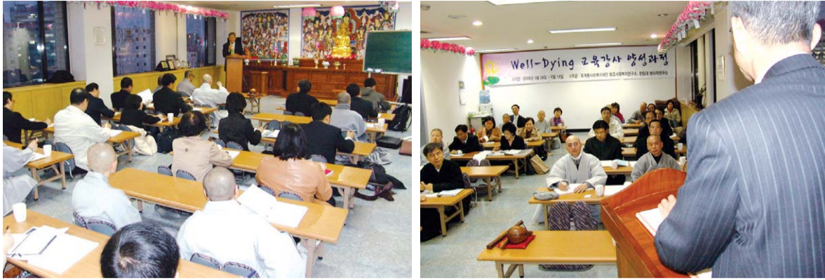
생각보다 '잘 죽는 것'은 간단치 않다. 제대로 살기 위해 잘 죽는 법을 배우는 것은 꼭 필요하다. 요즘 조계종 사회복지재단 교육실에서 펼쳐지고 있는 '웰다잉 교육강사양성' 과정에도 그래서 뜨거운 관심이 모아지고 있다.