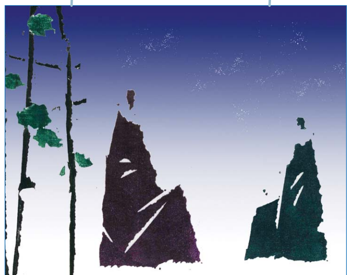
'앉은 자리 꽃자리' -마음.