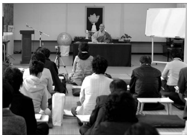
3월 26일 자비신행회에서 특강중인 금강 스님과 동참 불자들.

누구나 한번은 행복한 ‘나는 누구인가’에 대한 물음에 대한 해답은 어디서 구해야할까? 가부좌를 틀고 앉아 봐도 ‘나는 누구인가’에 대한 물음에 ‘나를 잘 알고 있는지’에 대한 궁금증까지 더해져 간화선은 어렵기만 했다. 간화선이 무엇인지, 어떻게 하는 것인지에 대해 쉽게 입문할 수 있는 강의가 마련됐다. 빛고를 광주의 대표적인 수행단체인 자비신행회는 3월 26일부터 5월 7일까지 매주 수요일 마다 7회에 걸쳐 간화선을 중심으로 불교의 수행론에 대한 특별강의를 연다. 금강 스님(해남 미황사 주지)이 진행하는 강의는 아함경을 기초로 한 초기불교수행, 간화선 그리고 육조단경 전반부에 있는 대인심(大信心) 등에 스님의 수행이야기가 더해져 누구나 쉽게 들을 수 있는 강의가 될 예정이다. 강사로 나선 금강 스님은 해남 미황사에서 서용 스님(前 조계종 종정)이 주창했던 ‘참사람운동’을 바탕으로 ‘참사람수련회’에서 재가 불자들에게 간화선 수행을 지도해 왔다. 스님은 “올바로 이해하고 믿어 의심치 않는 것이 대인심이다. 한국불교의 전통수행법인 간화선에 대해 대인심을 갖는 것이 중요하며, 믿음을 바탕으로 공부해 진전 된다”고 말했다. 스님은 이번 간화선 특강을 계기로 많은 재가 불자들이 간화선 수행에 동참하기를 바란다”고 말했다. 양행선 광주전남지사장