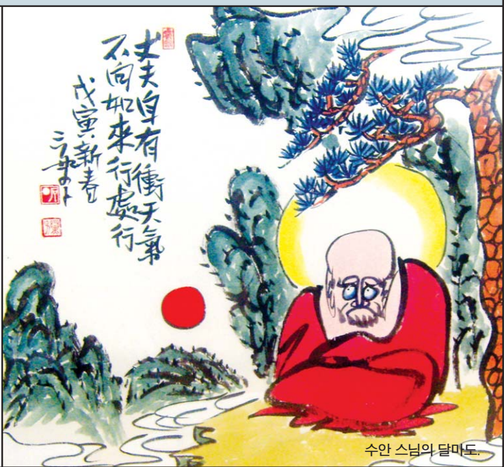
수안 스님의 달마도