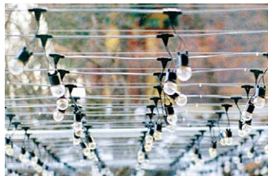
▷외부에 시공된 전선(케이블)