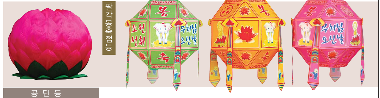
공 단 등

찬덕연등에서는 KS케이블 을 사용하여 가장 안전하게 전문 기술인에 의해 직접 감독 시공합니다.