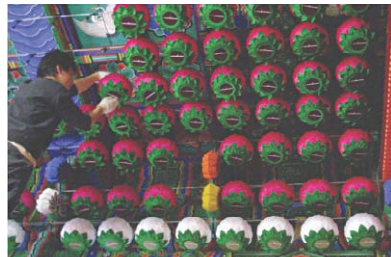
▷연등 설치 작업