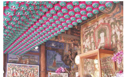
▷대구 파계사 원통전 천장 전기공사 및 연등 시공