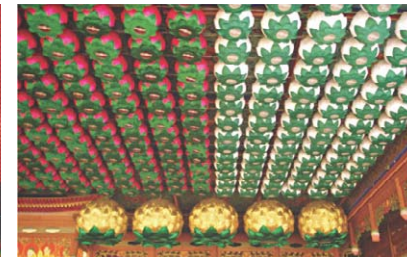
▷신갈 대덕사 연등 설치 모습