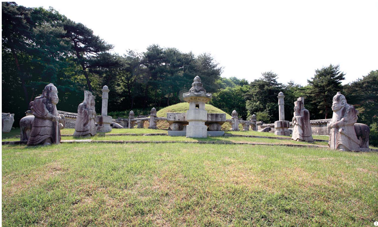
1 동구릉 능역 안 가장 호젓한 곳에 자리잡은 휘릉 2 휘릉의 문인석. 왼쪽 눈은 평평하고 오른쪽 눈은 돌출되어 있다. 세태를 비판하는 석공의 의지가 반영된 듯. 3 단종의 국장을 재현한 모습.

국상을 당하자 복상문제로 윤선도 등 남인과 송시열의 서인이 다툼을 벌인다. 송시열은 성리학을 근거로, 자식이 부모보다 먼저 죽었을 때 그 부모는 자식이 장자인 경우는 3년상을, 차자일 경우에는 1년상을 입도록 규정하고 있다는 논지를 내세웠다. 효종이 차자이므로 자의대비는 1년간 상복을 입어야