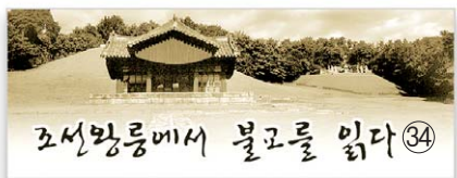
인조 계비 장렬왕후 - 휘릉

최고의 법문은 죽음이요. 죽음 앞에선 엄숙해지지 않을 수 없다. 왕후장상이든 이를 없는 무지렁이든 죽음의 비중은 같다. 망자를 위한 마지막 예의가 죽음의 의식이다. 차안에서 피안으로 가는 장엄하고 숙연한 의식이 장례다.