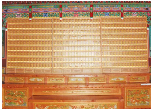
수원 팔달사 영구위패

찬덕연등이 개발한 새로운 개념의 신상품 영구위패 · LED 인등 · LED 전구