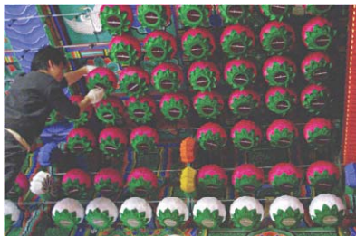
연등 설치 작업