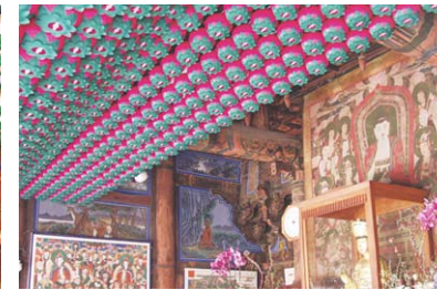
대구 파계사 원통전 현장 전기공사 및 연등 시공