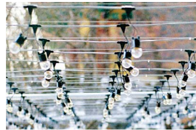
외부에 시공된 전선(케이블)