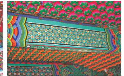
연등 설치 후