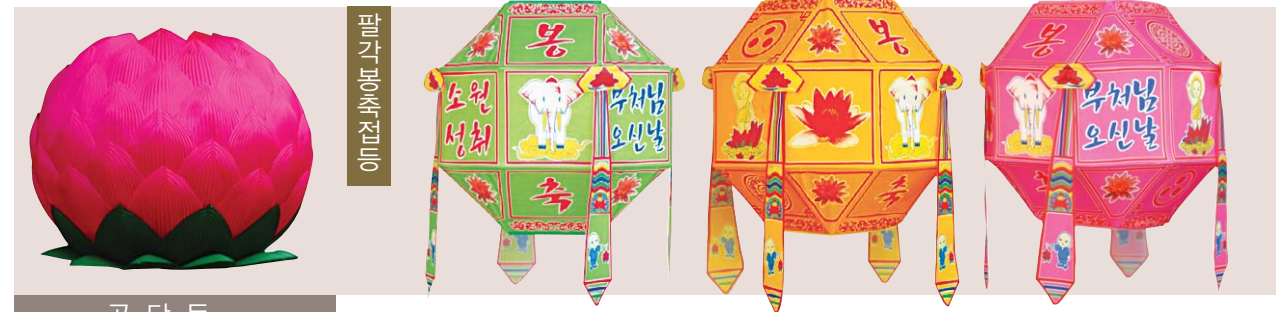
공 단 등

찬덕연등에서는 KS케이블을 사용하여 가장 안전하게 전문 기술인에 의해 직접 감독 시공합니다.