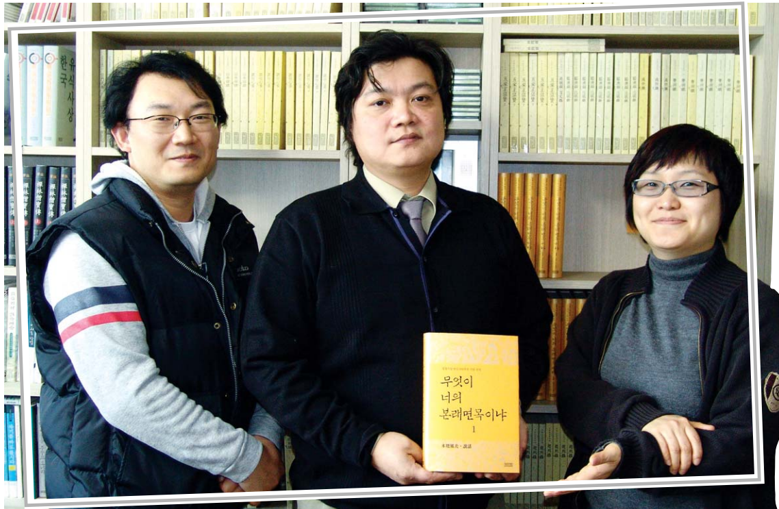
이시대에 맞는 선(禪) 사상 책을 출간하기 위해 애쓰고 있는 도서출판 장경각의 실무자들이 '성철 스님 탄신 100주년 기념 선서' 제1권을 선보이고 있다.