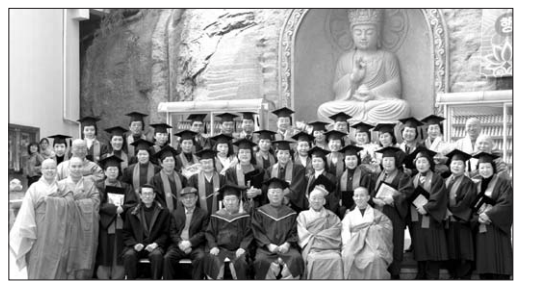
관음종 총림 서울불교문화대학은 2월 26일 낙산로각사 대불보전에서 2007학년도 불교학과 제1기 학위 수여식과 함께 보살계 수계식을 봉행했다. 총파 학장스님은 졸업식사를 통해 "부처님 법을 배우는 데에는 끝이 없기 때문에 학위를 받았다고 하더라도 계속 정진해주시길 바란다"고 당부했다. 한편 이날 수여식에서는 총 33명이 졸업장 및 보살계첩을 받았다. 김주영 기자