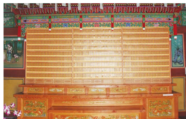
수원 팔달사 영구위패