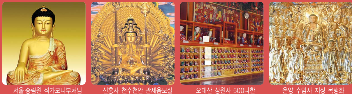
서울 송림원 석가모니부처님