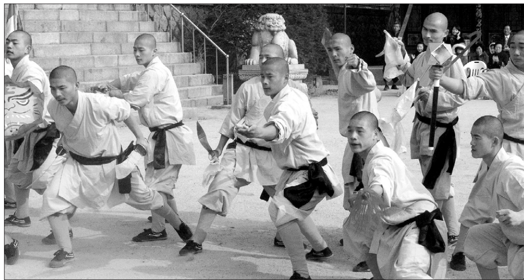
대한호국불교 소림선종 초청으로 2월 19일부터 4일간 방한한 중국 승산 소림사 20여 스님들이 신촌 봉원사에서 무술시범을 보이고 있다.

올해 부처님오신날 표어는 '수행 정진으로 세상을 향기롭게'로 선정됐다. 부처님오신날 봉축위원회는 2월 21일, 지난 1월 실시한 봉축표어 공모를 통해 접수된 330점에 대한 심사 결과 정진회(서울 양천구계사)가 응모한 표어가 당선됐다고 발표했다. 봉축위원회는 '수행 정진으로 세상을 향기롭게'라는 표어가 '생활 속에서의 수행과 치열한 정진으로 세상을 향기롭게 만들자'는 의미를 담고 있다고 설명했다. 여수령 기자