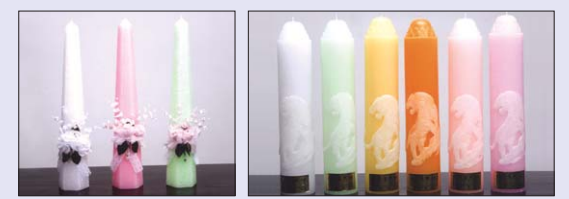
■ 육각초 45cm ■ 아광 호랑이(산신) 70φ X 35cm