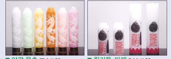
■ 아광 몽초 70φ X 35cm ■ 원기둥 마패 등신불 마패 7.4φ X 30cm 4.7φ X 19.5cm